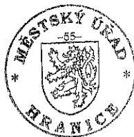
Bc. Zuzana Hiklová samostatný referent oddělení životního prostředí

Proti tomuto rozhodnutí lze podat odvolání. Odvolat se může účastník řízení ve lhůtě do 15 dnů ode dne, kdy mu bylo rozhodnutí oznámeno. Odvolání se podává u Odboru stavební úřad, životního prostředí a dopravy Městského úřadu Hranice. O odvolání rozhoduje Odbor dopravy a silničního hospodářství Krajského úřadu Olomouckého kraje. Lhůta pro podání odvolání se počítá ode dne následujícího po doručení písemného vyhotovení rozhodnutí, nejpozději však po uplynutí desátého dne ode dne, kdy bylo nedoručené a uložené rozhodnutí připraveno k vyzvednutí. Odvolání musí mít náležitosti uvedené dle ustanovení § 37 odst. 2 správního řádu a podává se v počtu stejnopisů stanoveném v ustanovení § 82 odst. 2 správního řádu. Odvolání nemá odkladný účinek.